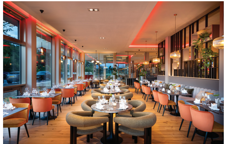
Leonardo Royal Hotel Cologne Bonn Airport

Änderungen vorbehalten. Stand: April 2026